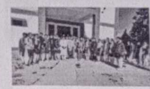
राजकीय महाविद्यालय तलवाड़ी में महिला स्वास्थ्य एवं स्वच्छता

Home / 2022 / November / 17 / राजकीय महाविद्यालय तलवाड़ी में महिला स्वास्थ्य एवं स्वच्छता पर सेमिनार का आयोजन किया गया।