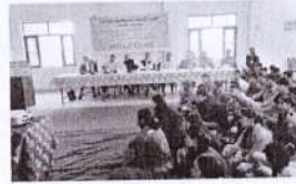
उत्तराखण्ड गढ़वाल चमोली

नई शिक्षा नीति पर राजकीय महाविद्यालय जलवाड़ी में नई शिक्षा नीति पर हुए विभिन्न कार्यक्रम ।