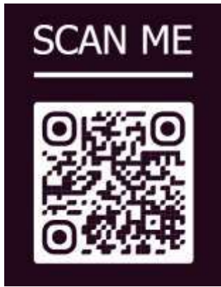
College Magazine (Buransh)