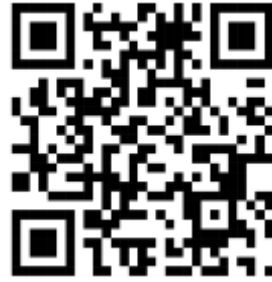
Principles of Plant Genetics and Breeding