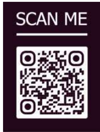
College Facebook page