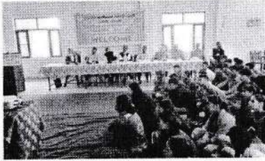
उत्तराखण्ड गढ़वाल चमोली

नई शिक्षा नीति पर राजकीय महाविद्यालय तलवाड़ी में नई शिक्षा नीति पर हुए विभिन्न कार्यक्रम ।